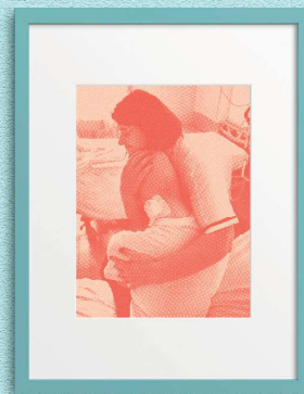
CURA DELLA RELAZIONE 12 MAGGIO: GIORNATA INTERNAZIONALE DELL'INFERMIERE

IL TALENTO DEGLI INFERMIERI ARTE E SCIENZA IN EVOLUZIONE.