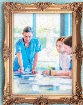
PASSIONE E FORMAZIONE LUNTI IN LUNGA 12 MAGGIO: GIORNATA INTERNAZIONALE DELL'INFERMIERE